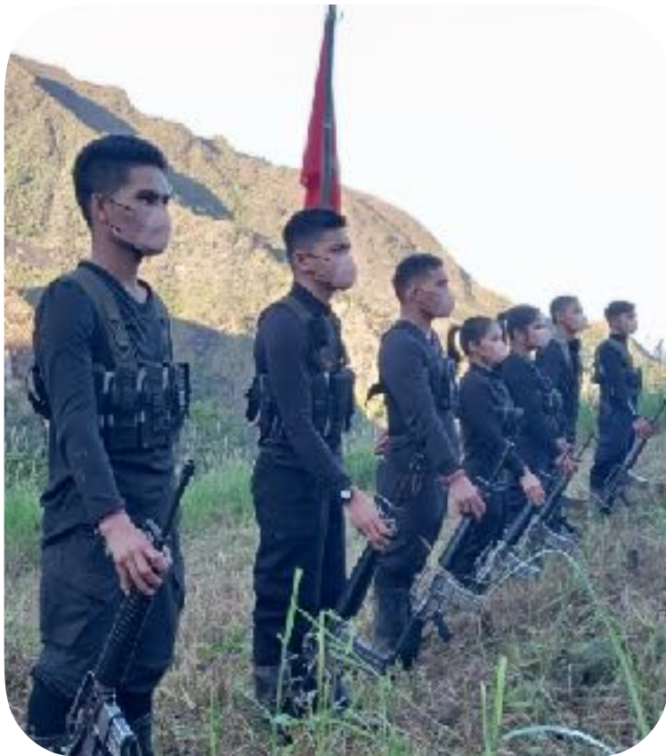
Mga mandirigma ng BHB mula sa North Central Mindanao nakapormasyon para sa 21-gun salute na alay kay Ka Joma

Imposible na mapipigilan ng reaksyunaryong estado ang mga kadre ng PKP na ipatupad ang kanilang mga tungkulin sa gawaing ideolohiya. Sa paglipas ng mga taon at dekada, sa pangunguna ng Rebolusyong Paaralan ng Kaisipang Mao Zedong, nakapagbigay- edukasyon sila sa mas marami pang kadre at kasapi ng Partido sa takbo ng paggagawaing masa at naipadaan sila sa batayan, intermedya at abanteng antas ng edukasyon ng Partido matapos makuha ang